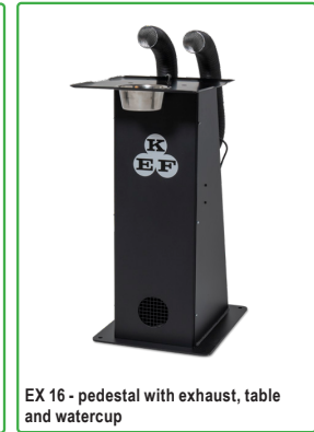
EX 16 - pedestal with exhaust, table and watercup Art.nr. 10 22 332 - 1x230V Art.nr. 10 22 324 - 3x400V