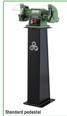
Standard pedestal Art.nr. 02 02 981